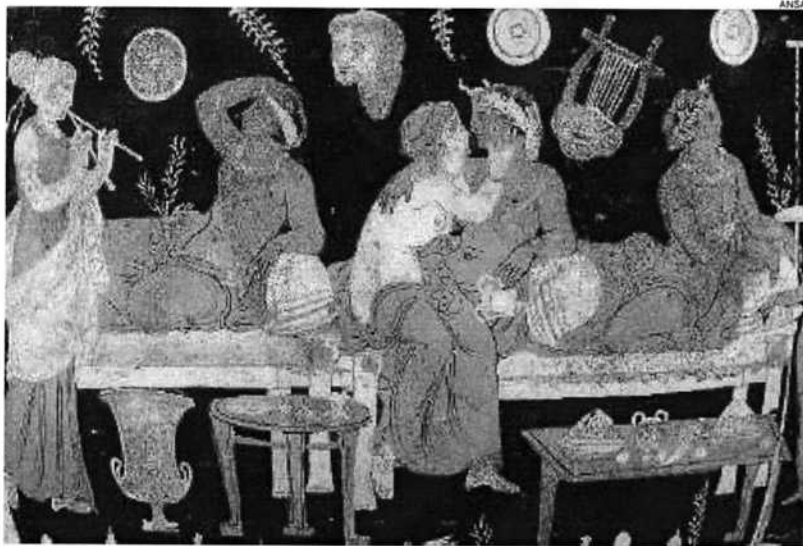
► Una ceramica con soggetto erotico dal Museo Archeologico Nazionale di Napoli